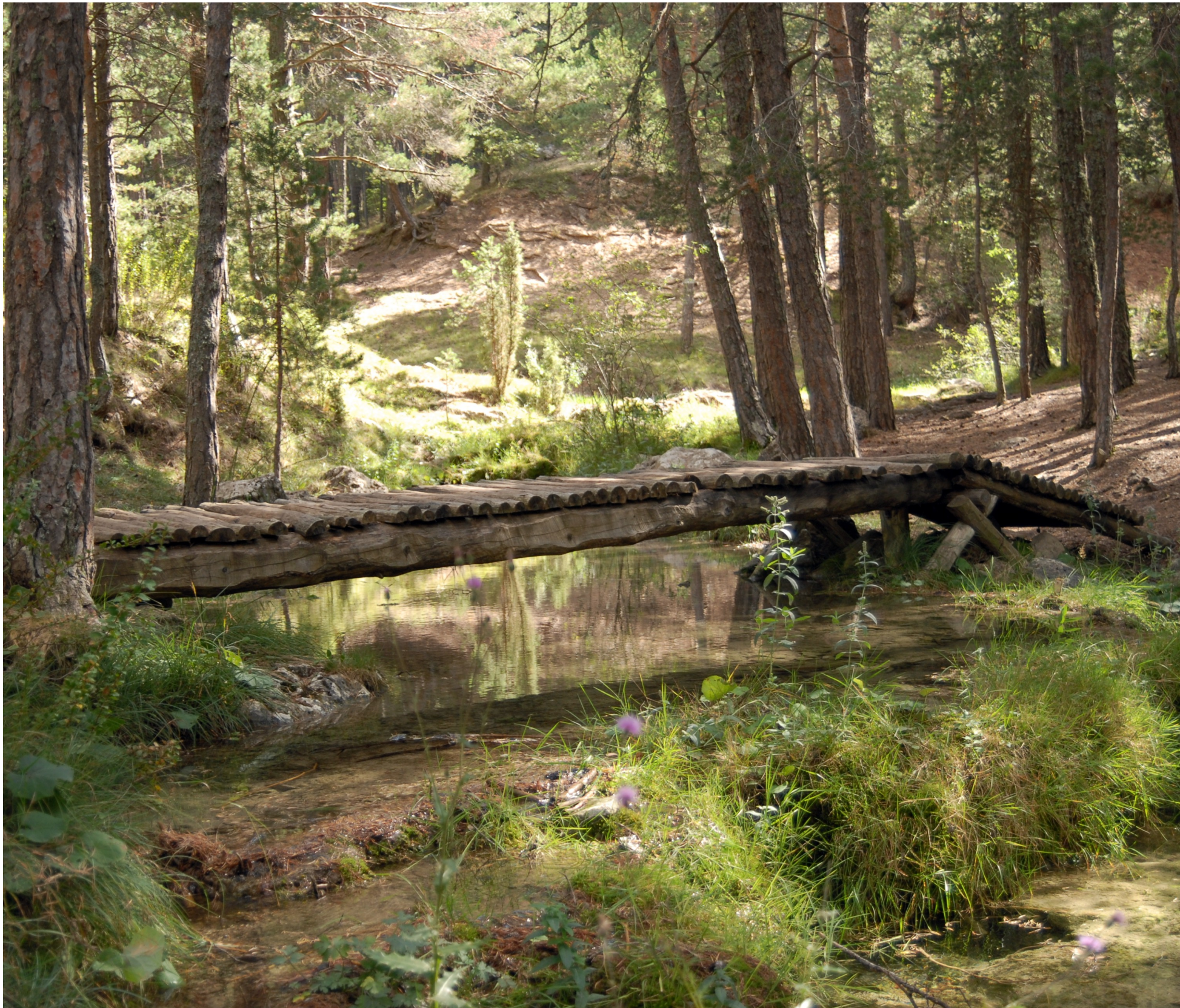
Río Mijares en Cedrillas

La unidad básica de gestión del un plan hidrológico es la masa de agua. En el caso de los ríos la masa de agua se corresponde con una parte diferenciada y significativa de agua superficial que mantiene unas características homogéneas.